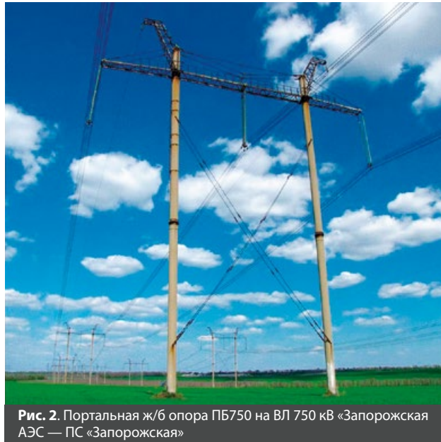
Рис. 2. Портальная ж/б опора ПБ750 на ВЛ 750 кВ «Запорожская АЭС — ПС «Запорожская»

Фундаментные секции, как и секции стоек, снабжены закладными элементами в виде внутреннего фланца для соединения со стойкой опоры. Конструкция внутреннего соединительного фланца позволяет при изготовлении 20-метровой стойки кольцевого сечения с напрягаемой арматурой разделить ее на части, а затем в процессе монтажа объединить при помощи обычных болтов.